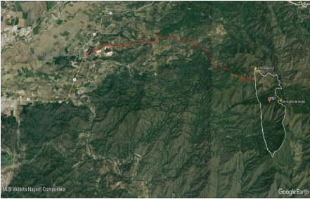
MLS Vallarta Nayari Compostela