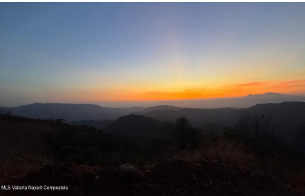
MLS Vallarta Nayari Compostela