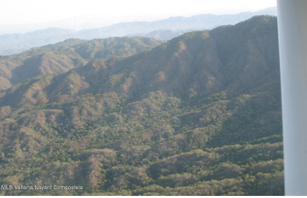
MLS Vallarta Nayari Compostela