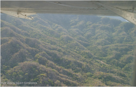
MLS Vallarta Nayari Compostela