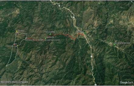
MLS Vallarta Nayari Compostela