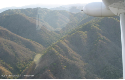
MLS Vallarta Nayari Compostela