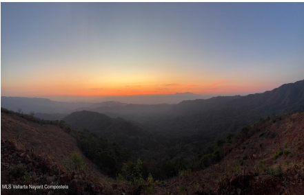
MLS Vallarta Nayari Compostela